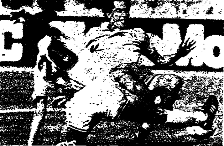
صراع على الكرة بين سيومن وكريكا (رويتر)